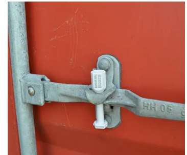
Verzegeling deuren / afsluiters